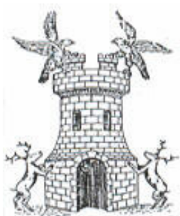
Estación de Chinchilla Chinchilla de Montearagón